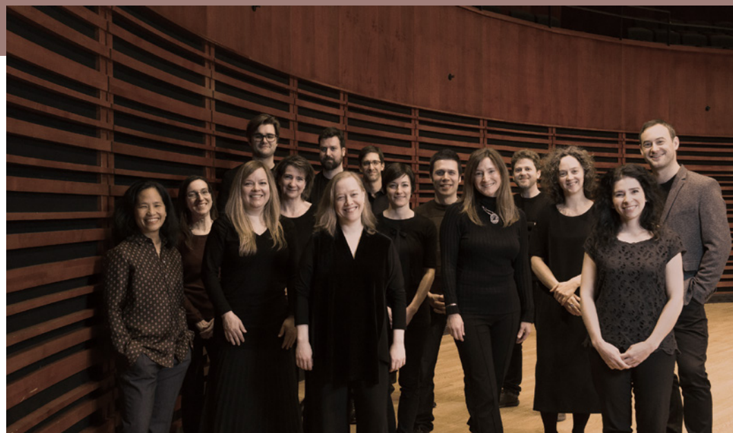
레 비올롱 뒤 루아 / 지휘: 조너선 코헨(Jonathan Cohen)

“바로크 활을 사용함으로써 시대악기 악단과 같은 투명하고 유연하며 세련된 연주를 구사할 뿐 아니라 이들의 정확한 기교는 연주자와 관객 모두에게 귀감이 된다.”