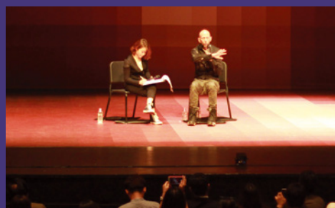
안무가 웨인 맥그리거 <아토모스> 관객과의 대화, 2017