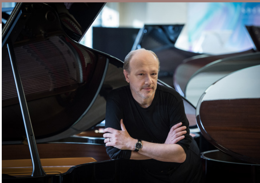
피아노: 마르크 앙드레 아믈랭(Marc-André Hamelin)