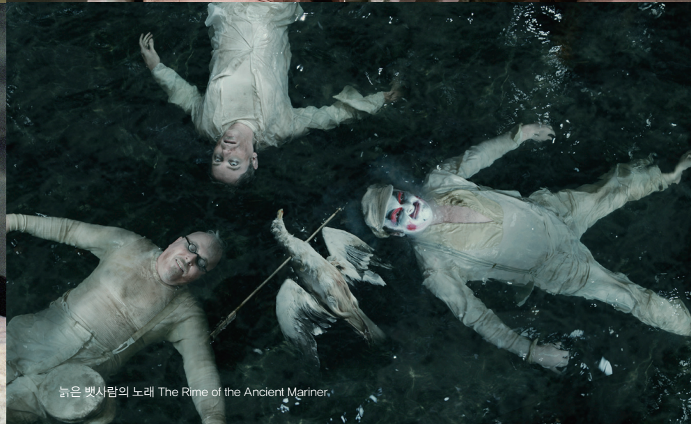
높은 뱃사람의 노래 The Rime of the Ancient Mariner.