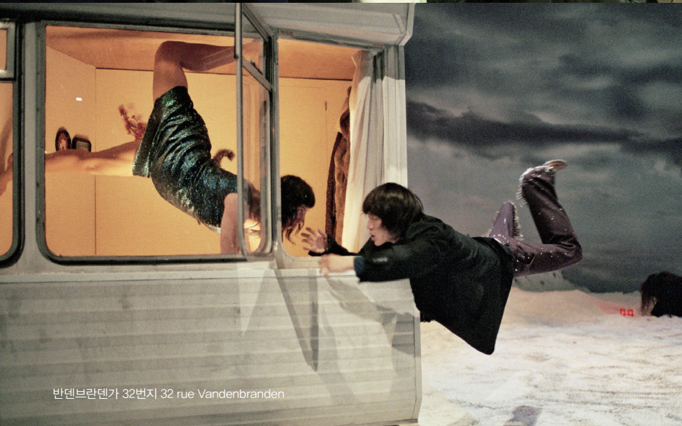
반덴브란덴가 32번지 32 rue Vandenbranden