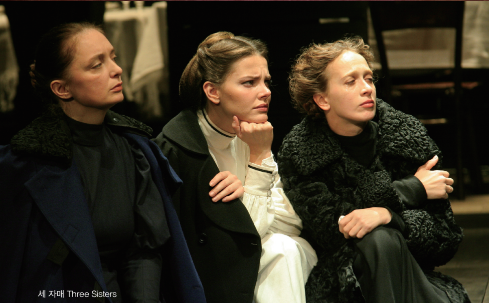
세 자매 Three Sisters