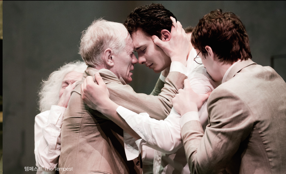
템페스트 The Tempest